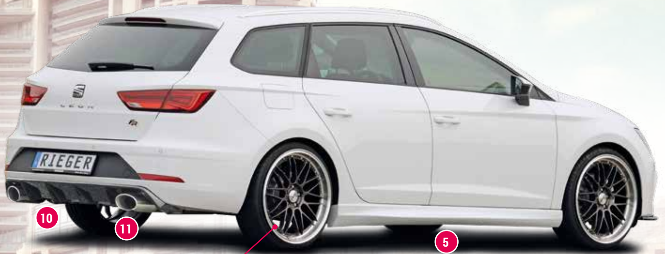
Dotz Revvo VA + HA 8,5x20 ET45 mit 235/30-20